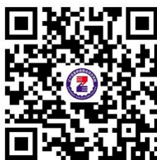
14.学生休学和复学办理

14.3 办理时限：10 个工作日（周一至周五 9:00-16:00，节假日、法定假日和寒暑假休息）