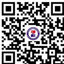
17.学生社团设立申请