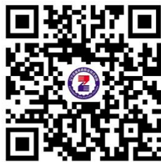
12. 毕业生求职创业补贴申请